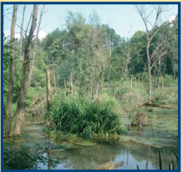
Feuchtbiotop - Erlenbruchwald