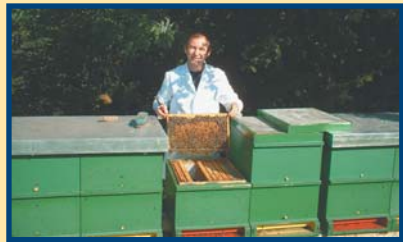
Bienenstöcke in freier Natur