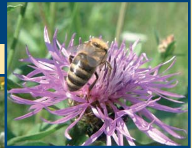
Wiesen-Flockenblume - Centaurea jacea