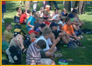
Unterricht in freier Natur