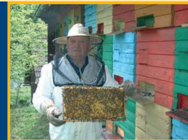
Imker bei der Betreuung von Bienen

Die Arbeit der Imker sichert den Obstreichtum im Lavanttal!