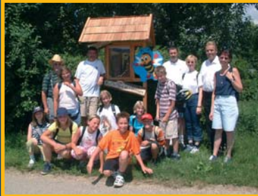
Informationstafel am Bienenlehrpfad