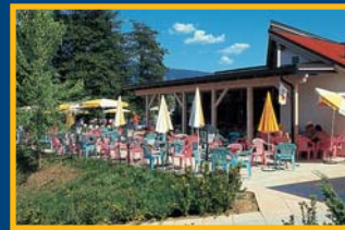
Strandcafe am St. Andräer See