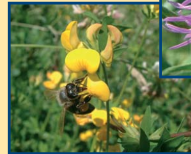
Gewöhnlicher Hornklee - Lotus corniculatus