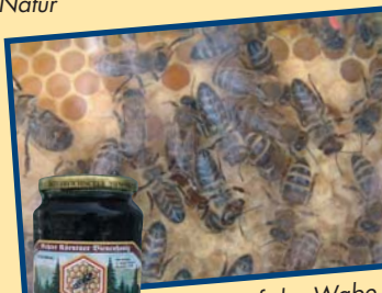
Bienen auf der Wabe

ist meist von heller Farbe und je nach der Art der Blüten, von denen er gesammelt wurde, verschiedenfärbig.