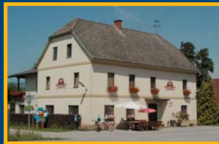
Gasthaus JÄGER vlg. Müllerwirt in Mühldorf