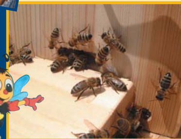
Bienen beim Flugloch des Bienenstocks